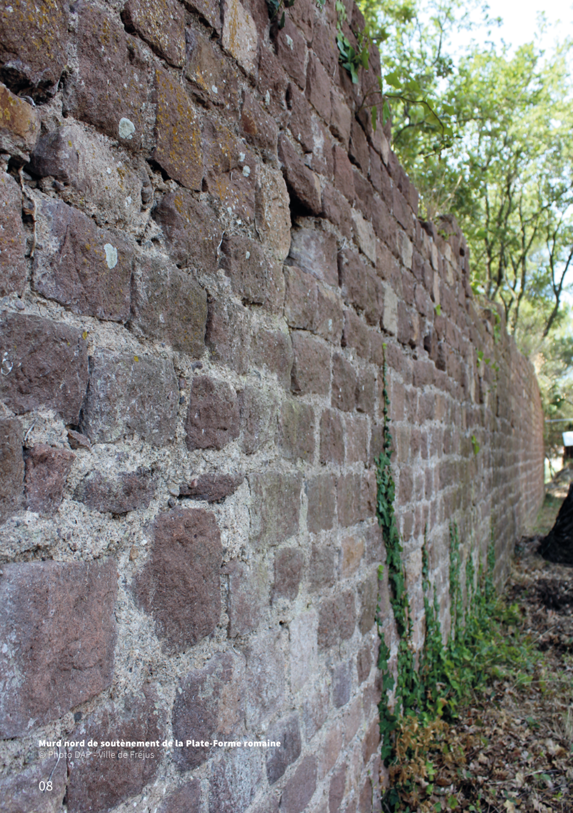
Mur nord de soutènement de la Plate-Forme romaine