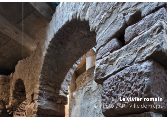
Le vivier romain