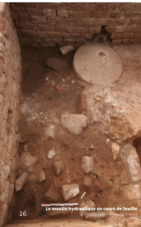
Le moulin hydraulique en cours de fouille

La communication illustre la collaboration entre archéologue et architecte pour analyser les documents, soulever les problèmes que pose la restitution de cet exemple. Le but est d'exposer les choix et de montrer les solutions liées à la réalisation des