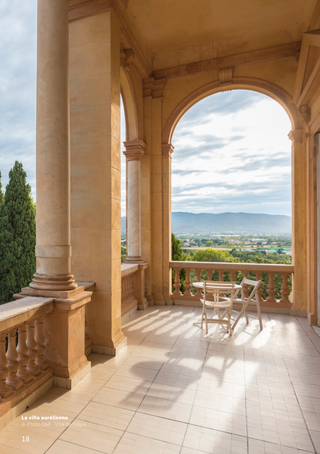
La villa aurélienne