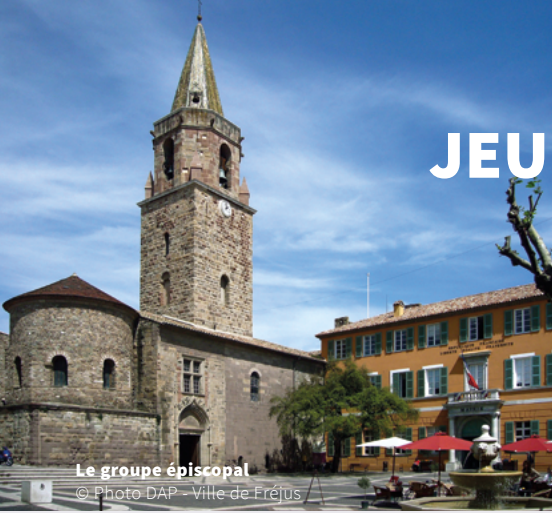
Le groupe épiscopal