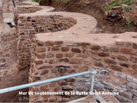
Mur de soutènement de la Butte Saint-Antoine