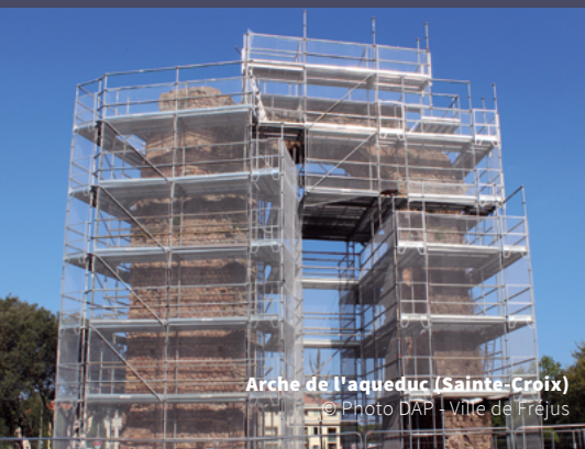
Arche de l'aqueduc (Sainte-Croix)

Lo studio dei danni subiti da monumenti in occasione di terremoti recenti ha messo in luce come la loro "vulnerabilità" sia legata soprattutto alle modalità di costruzione e trasformazione nel tempo, ai dissesti, e alle relative riparazioni; si è constatato inoltre che i dissesti causati da sismi una volta attivati hanno natura progressiva e recidivante. Per progettare il miglioramento sismico di una costruzione del passato diviene perciò necessario conoscere l'insieme di discontinuità, disomogeneità e dissesti che questo processo ha stratificato su di essa.