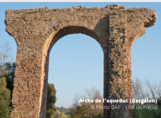
Arche de l'aqueduc (Gargalon)

Tenter de redonner une idée crédible d'ensembles aussi complexes que les villes antiques, implique une méthodologie issue de l'étude de cas concrets et de la collaboration entre l'archéologue et l'architecte. Ceci consiste en l'élaboration d'un modèle théorique. Il s'agit pour les chercheurs de se transmettre, à un moment de leur réflexion scientifique, une idée claire, certes perfectible, mais qui a le mérite d'être compréhensible pour le public. De nombreux exemples (Arles, Lutèce, Lyon, Nîmes, Narbonne, Fréjus !) aideront à comprendre le cheminement de la pensée, les problèmes rencontrés et les solutions proposées.