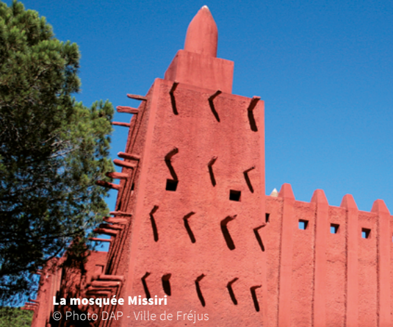
La mosquée Missiri